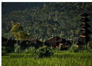
Ubud 📍 🚗 34km - ⌚ 1h 10m Sidemen 📍