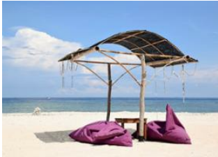
Gili Air 📍