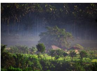
Tirtagangga - 4h Tenganan 🚗 - 1h 30m Sanur