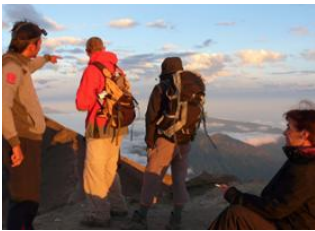
Sidemen - 7h Mt Agung 🚗 - 1h Tirtagangga