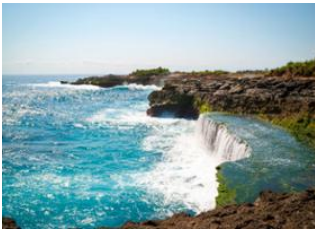
Nusa Lembongan 📍