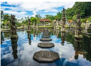
Amed 17km - 50m Tirtagangga 14km - 30m Pasir Putih - 25m Candidasa