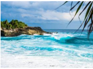
Nusa Lembongan 📍