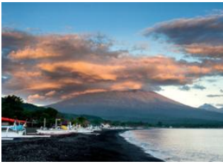
Lovina Beach 90km - 2h 30m Amed