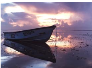
Nusa Lembongan 📍